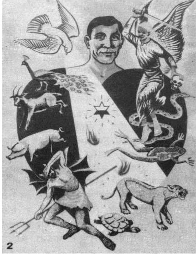
२.दोषी पश्चात्तापीओ मी-गीन

कूरीकी खूटडडीले ।”(हिब्रू ४:१२) परमेश्वरौ वचनै होस्की ईसे आरमेटाक्ले : “ पापौ जेला सीकी हो ।” अनि “भरमीए काखेप सीकीनै परले होटई होस न्हड न्यायौ लागि खडा छान्की परले । ( हिब्रू ९:२७) “ पापी र अविस्वासीकूरीकुड भाकचहीं म्हे र गन्धकै न्हेप्च कूणडाड छान्ले ।” (प्रकाश २१:८) स्वर्गदूतौ अर्को मी-हूटाड काट खप्पर ले । ईसे खप्परै पापीकूरीकी काखेप कान् पट्टै सीकीनै परले डेच आरमेट (संभना) याहाले । कानूड ईसे जीउ जसकी कान् ईडीक माया जाटले,बढीन बील्हकाले कासाक्ले,सीङ्गारडीले र ईचेउ अभिलाषा पूरा जाटाक्की पट्ट खालौ हेरचाह जाटले । तर कायाक ईसे सीम घेरेल्ले । तब कानूड हंस,जो सेनर मासीले,होसे परमेश्वरौ खेरेप न्यायौ निमित्त टोड्की परले ।