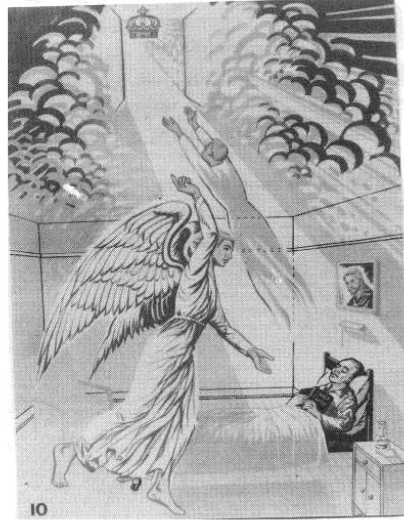
१० महिमासाठान स्वर्ग नूच

होसे खीष्टियन येशूओ मीटाहा ओस्की पाले, हीजैडेनाड होस्कोनै होचेऊ निम्ति कूसै सीकीछाना र होस्की उद्धार