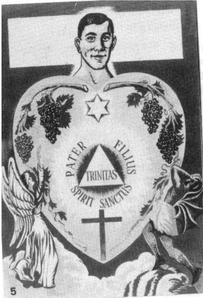
५. ईसे मी-गीन परमेश्वरौ मन्दिर हो

ईसे मी-गीन परमेश्वरौ साँच्चै थान (मन्दिर) छान्मने । ईतै पाप ख्योहाक्ने । भूठौ बोई शैतानलेकीड खाल-खालौ जन्तुकूरीए शासन जाट्च मी-गीनाड आब कान् पवित्र आत्मा, सत्यौ आत्मा बासउँच डाड्ले । पापौ मासेहेच बैठकौ सट्टा आब होचेऊ मी-गीन सेहेच (मजूड) मीस्या स्याहाच (फलस्याहाच) गाछी अथवा बगैचा लेखा छान्मने । होचेई आत्मौ मीस्या (फल) स्याहाक्ले, जस्तै, प्रेम, आनन्द, शान्ति, धीरज, दया, भलाई विस्वास, नम्रता, संयम र ईन्चन परमेश्वर र भरमीकूरीकी जाक्च सेहेच गूणकूरी । आब होसे सच्चा अङ्गुरौ फल स्याहाक्च डाला छान्मने । जून दाखौ बोट कानूड प्रभू येशू खीष्ट मेल्हानै हो । ईसे फल स्याहाच रहस्य ईसे हो, होसे खीष्टाड उँले र होस्कौ वचनकूरी होस्वाटा उँले । (यूहन्ना १५:१-१०) सेहेच हंसौ/पवित्र-आत्मौ भरपूरी र बप्तिष्मा डूप्चन्हनीड हा शारीरिक अभिलाषामीटाक जूच फेस(शक्ति) ले । सेहेच हंसौ/पवित्र आत्मौ फेसै होसे आत्मिकाड ह्वाकी र शरीरमीटाक जूकी फेस(शक्ति) डूप्मने । होसे अब सेच भराड, डाड्च भराड र लोहो मी-मन अन्सार माह्वाले, तर विस्वासलेकीड जीवन जीले अथवा बितडीले, हीजैडेनाड खीष्टमीटाक विस्वास जाट्की नै जूकी हो । “मी-गीनाड सेहेच (शुद्ध) छान्चकूरी धन्य हो, हीजैडेनाड होस्कूरीए परमेश्वरकी डाड्ले ।” (मत्ती ५:९)