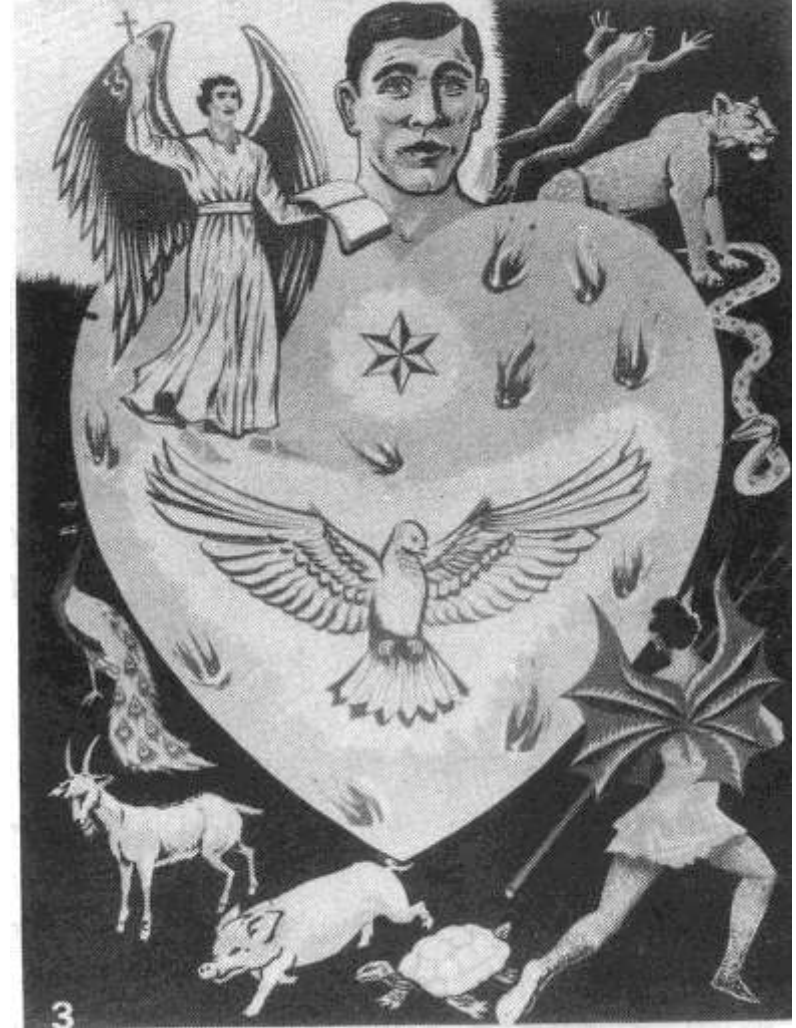
३. पश्चातापी मी-गीन

ईसे तस्वीरै काट सच्चा पश्चातापी भरमीकूड मी-गीनौ अवस्था टान्हाक्ले । चाँहा होचेई धेरै बीरम्हसेच पापकूरी डाड्ले, जसौ कारन येशू क्रूसाड सीकी छाना । जब होसे पापीए क्रूसकी डाल्हे, जून क्रूस स्वर्गदूतै परमेश्वरौ वचनलेकीड टान्हाक्ले, तब होसे दृष्यै होचेऊ पश्चातापी मी-गीन भाराले र गम्भीर शोक मीरापडीए मेल्लौ धेरै पापौ कारनै मी-गीन बीक्ले । होचेई खीष्ट येशूआड लेच परमेश्वरौ क्हाड्च प्रेमकी डाल्हे । ईसे प्रेमै होचेऊ मी-गीन पगाल्डीम याहाले । विशेष जाटार जब होचेई ईसे आर्-