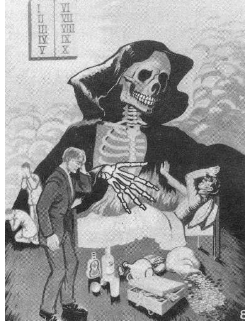
८. पापी भरमीओ काल अनि डण्ड

ईला कानै अल्याड् टल्याड् जाट्च पापी र विस्वासलेकीड न्हड्लाक हट्डीस्च भरमीकी सीकी पाच अवस्थाड डाड्ले । चाँहा होचेऊ मी-मन मृत्युओ बीरम्ह (डर) र दुःखै न्हेनने । काल अचा